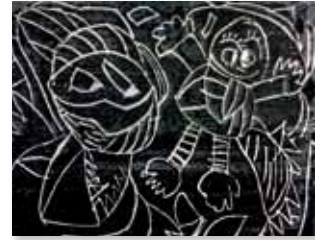
「青藤知笑」絵具・スポンジシート・画用紙 H270×W370