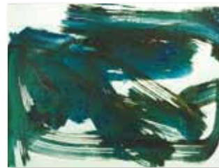
「伊藤洋章」絵具・ラメ・画用紙 H300×W400