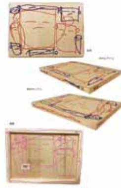
「舞」佐藤亮 ガスカ・キャンバス H242×W333