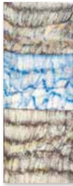
「心のとびら」五十嵐拓也 タービーペーパー・画用紙 H400×W530 8枚組