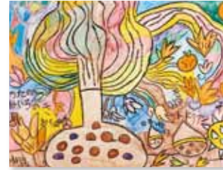
「ねいろの木」富樫マリア 色鉛筆・画用紙 H400×W550