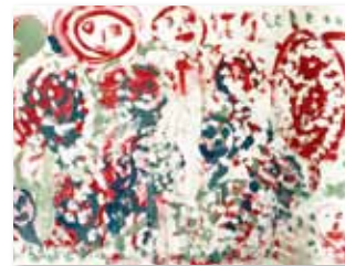
「はなのあいみん」堀井也 アクリル絵具・画用紙 H242×W333

主催：山形県生活サポート協会 協賛：株式会社ジェイアイシー・AIG損害保険株式会社仙台支店 協力：やまがたアートサポートセンターら・ら・ら