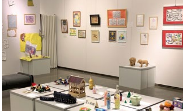
第1回 わたしとあなたの表現 展示風景

障がいのある人と、障がいのある人と関わりのある人たちが、お互いに交流する中で生まれた感性を表現した様々な作品を集めました。この作品展を通して、作品が多くの人目に触れることで、作り手のみなさんの表現活動がより広がりを見せることや、市民の方々の障がいへの理解や考えを深める場になることを願います。